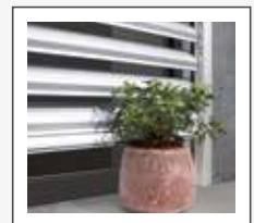
Detección de obstáculos