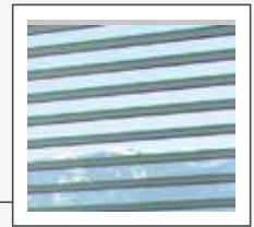
Sin uniones verticales visibles