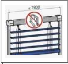
El sistema de persianas autoportante