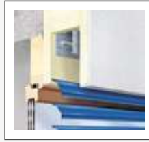
Sistema en nicho