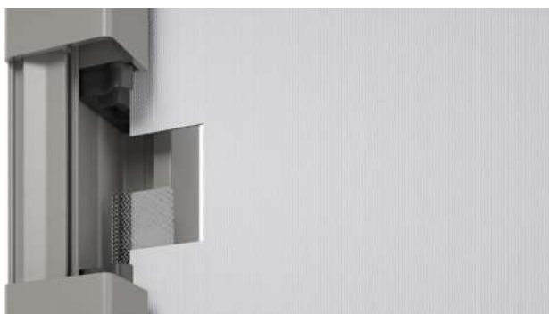
Sección del carril guía con perfil tracfix