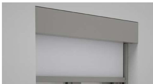
Fijación en huecos