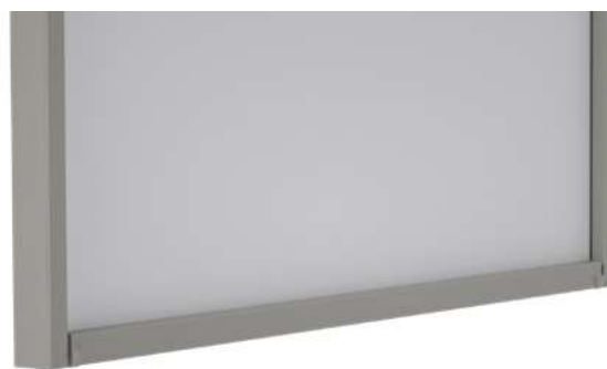
El perfil de salida termina completamente alineado con los carriles guía