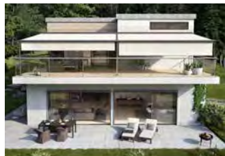
Toldos pérgola acoplados