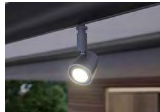
LED-Spots en el tubo de apoyo de la lona