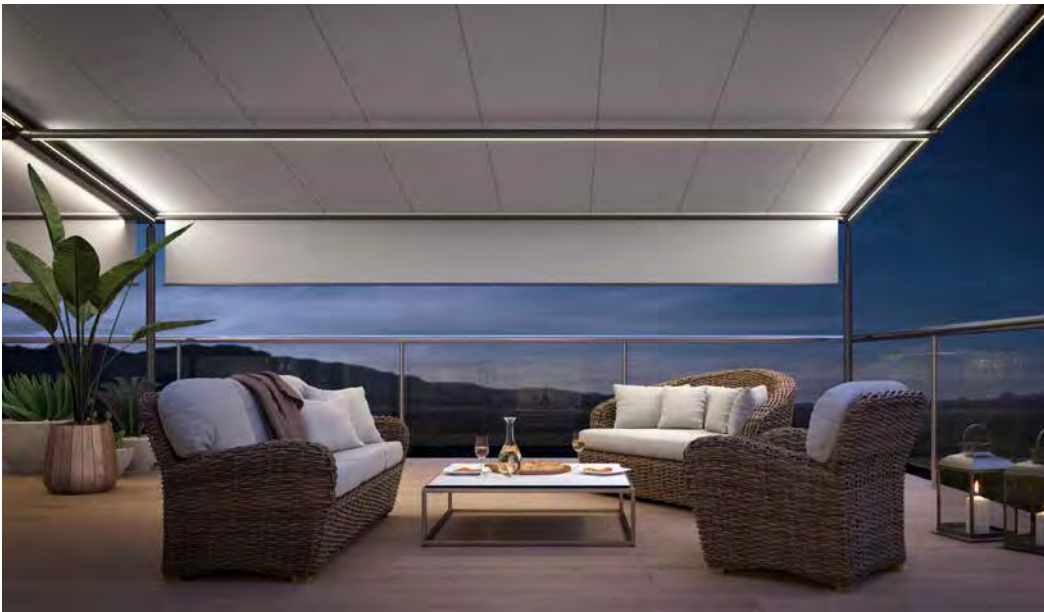
markilux súper-sombra e iluminación LED