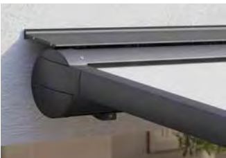
Cofre completo cerrado